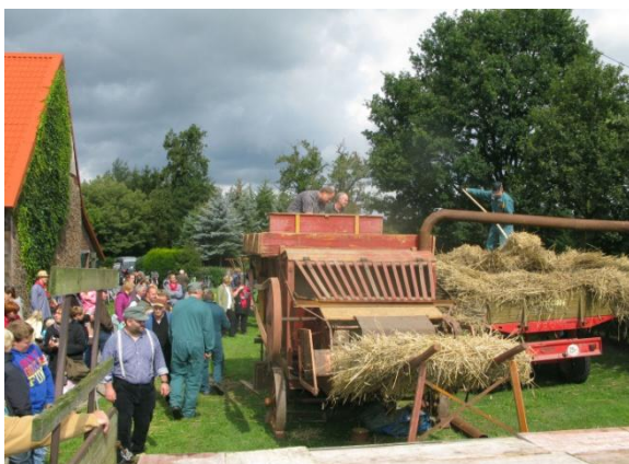
Die historischen Landmaschinen