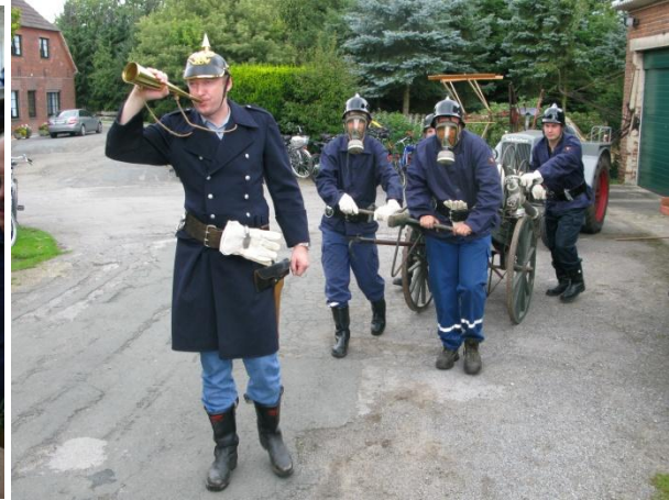
Die Historische Löschgruppe